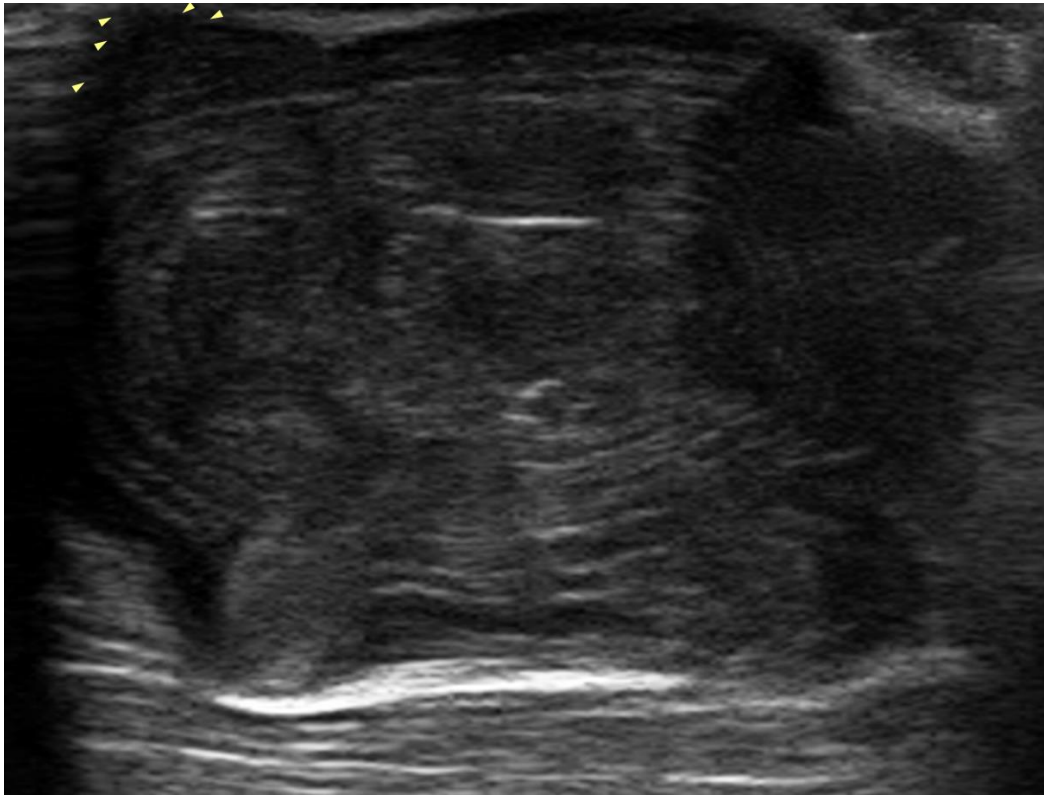
Figura 2: Estudio ecográfico con transductor multifrecuencia de partes blandas que muestra a mayor detalle la ecoestructura de la lesión inguinal derecha.