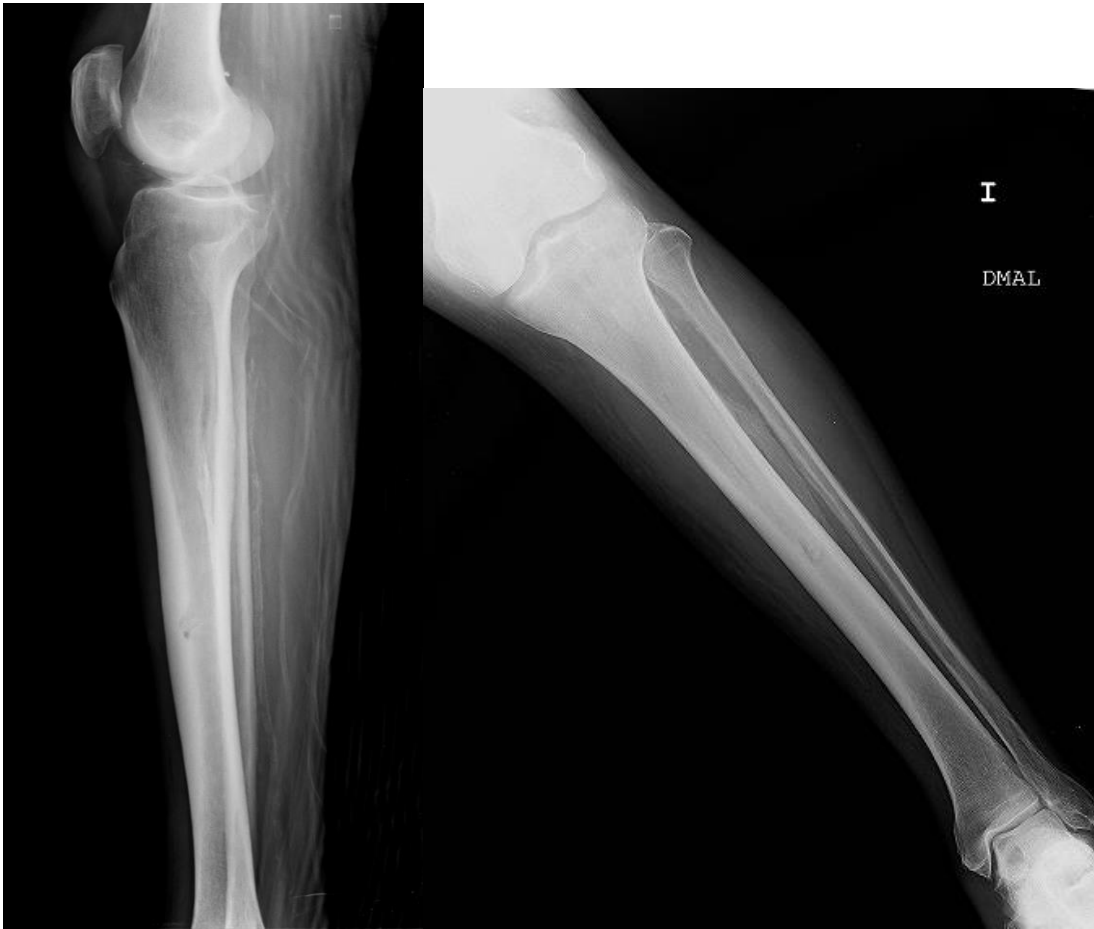
Fig.2a y 2b. Radiografía convencional AP y Lateral de la pierna izquierda.