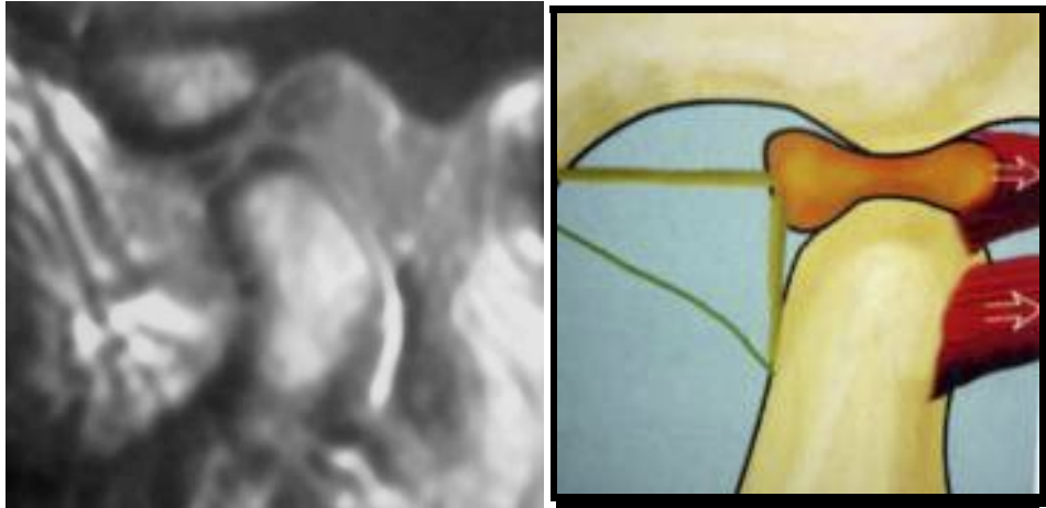
Fig 2. Disco recapturado en la apertura bucal con una ruptura central