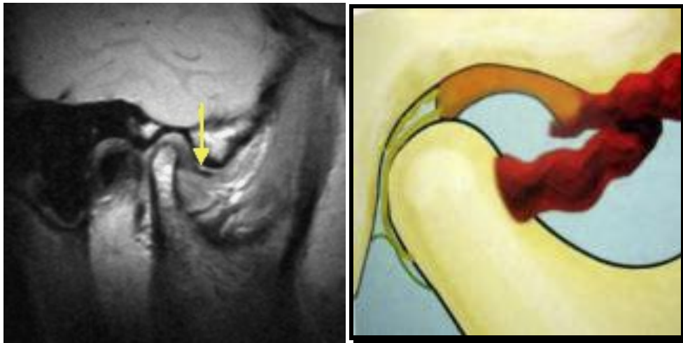
Fig 1. Luxación unidireccional anterior valorada en el plano sagital explorada en posición de boca cerrada

DISCO : Deformidad Ruptura Cambios en intensidad de señal